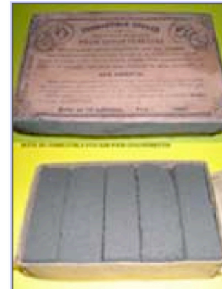
Boîte de tablettes de charbon STOCKER